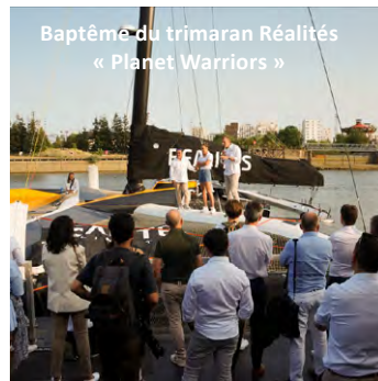
Baptême du trimaran Réalités « Planet Warriors »