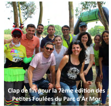
Clap de fin pour la 7ème édition des Petites Foulées du Parc d'Ar Mor