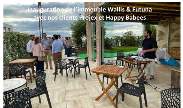
Inauguration de l'immeuble Wallis & Futuna avec nos clients Projex et Happy Babees