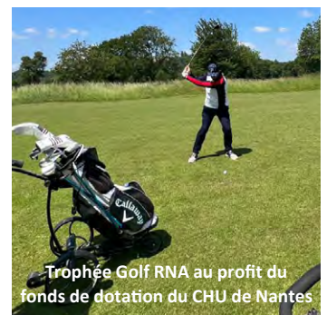
Trophée Golf RNA au profit du fonds de dotation du CHU de Nantes

CLERVILLE - CONSEIL IMMOBILIER D'ENTREPRISE 02 40 780 555 - contact@clerville.fr - www.clerville.fr 10 boulevard du Zénith - 44800 SAINT-HERBLAIN